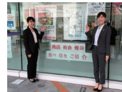
戸塚支店：ショーウィンドウにて飲食店を紹介（戸塚東口支店、芹が谷支店、東戸塚支店同時開催）

地域イベントへの参加やロビー展の開催などのCSR活動に、全営業店61店舗が積極的に取り組んでいます。各営業店の取組みは当金庫ホームページ「営業店トピックス」で紹介しています。