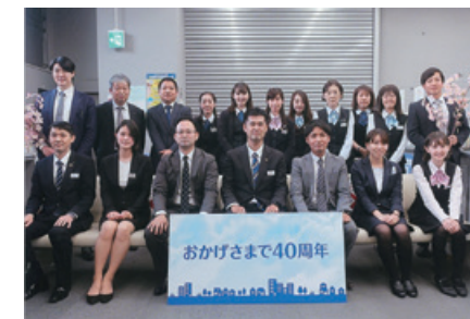
根岸橋支店開設40周年