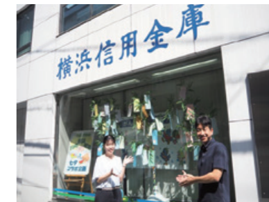
綱島支店：3信金と3つの保育園が連携して綱島の街を「七夕飾り」で彩る