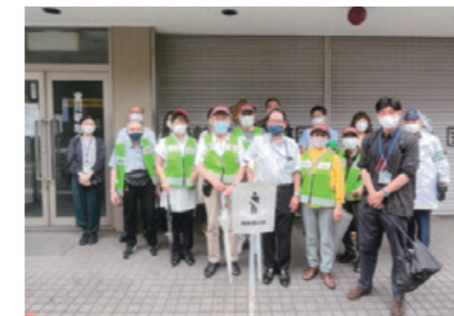
野毛町支店：野毛地区環境浄化防犯協議会合同パトロールに参加

地域イベントへの参加やロビー展の開催などのCSR活動に、全営業店61店舗が積極的に取り組んでいます。各営業店の取組みは当金庫ホームページ「営業店トピックス」で紹介しています。