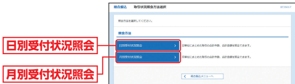
(画面は「総合振込」の場合です。)

取引状況照会方法選択画面が表示されますので、「 日別受付状況照会 」または「 月別受付状況照会 」ボタンをクリックしてください。