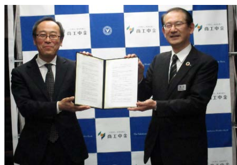
左：商工中金 木戸口営業部長

横浜信用金庫は、中小企業のサステナブル経営や円滑な資金調達を後押しし、中小企業の持続的成長を積極的にサポートしてまいります。