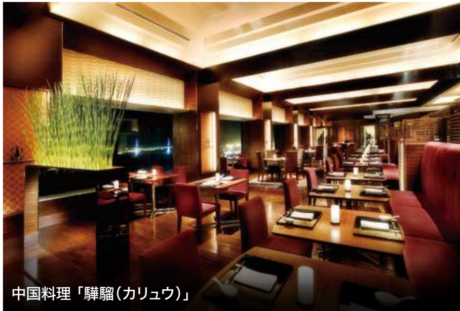
中国料理「驊騮(カリユウ)」