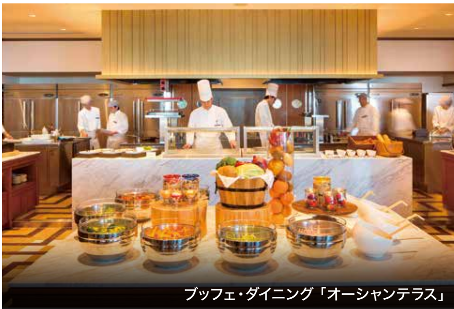
buffet・ダイニング「オーシャンテラス」

※除外日:4/26(土)~5/6(祝・火)、花火大会開催時、8/9(土)~8/17(日) ※他の割引との併用はできません