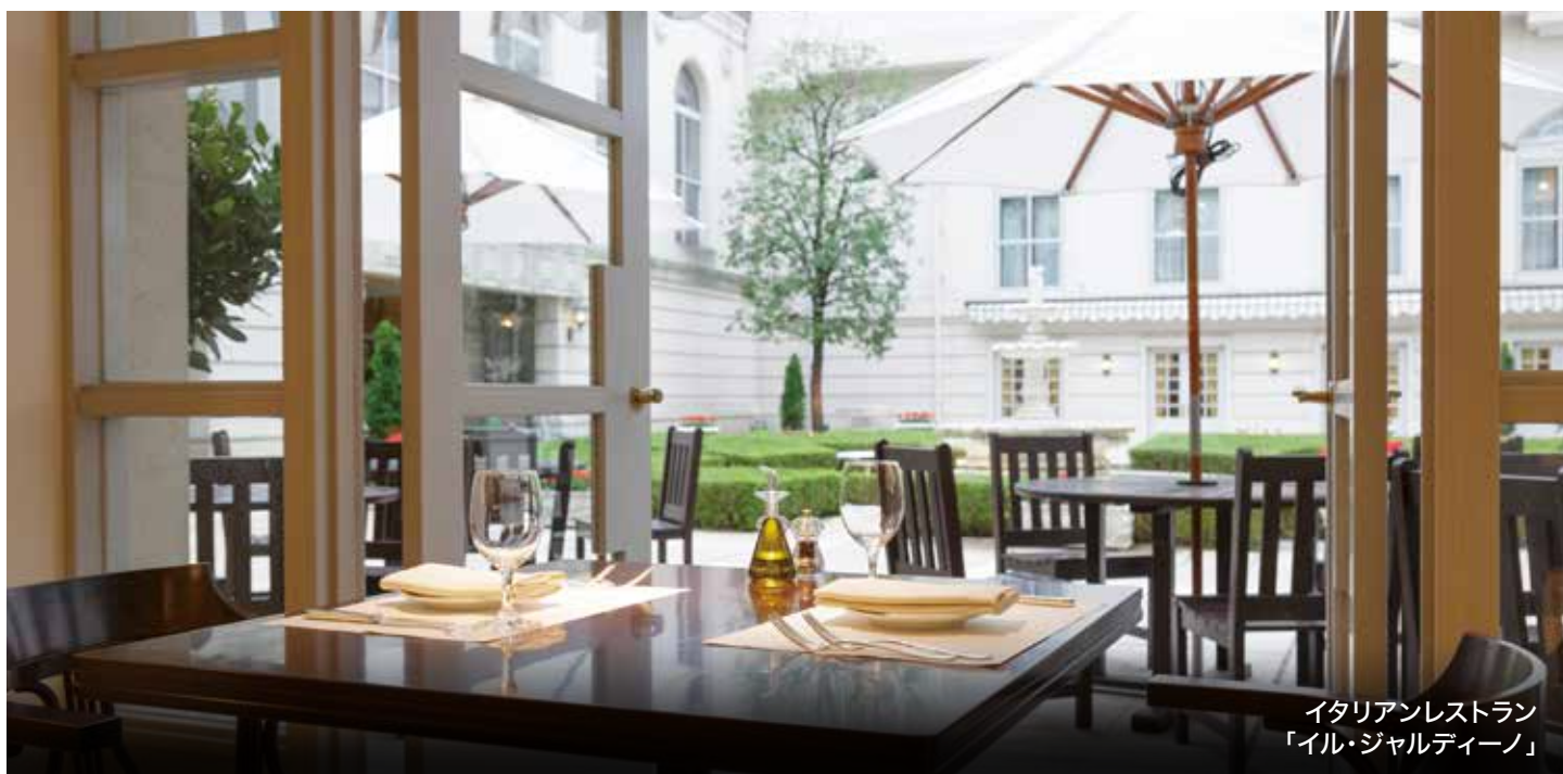
イタリアンレストラン 「イル・ジャルディーノ」