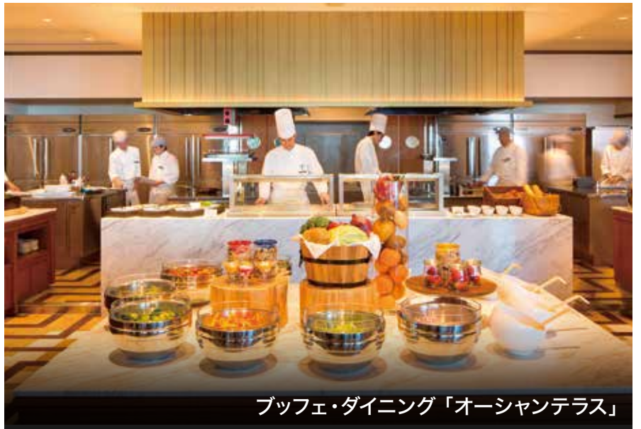
buffet dining「オーシャンテラス」

※除外日:26年4月24日(金)~5月6日(水)、花火大会開催日、26年8月7日(金)~8月16日(日) ※他の割引との併用はできません