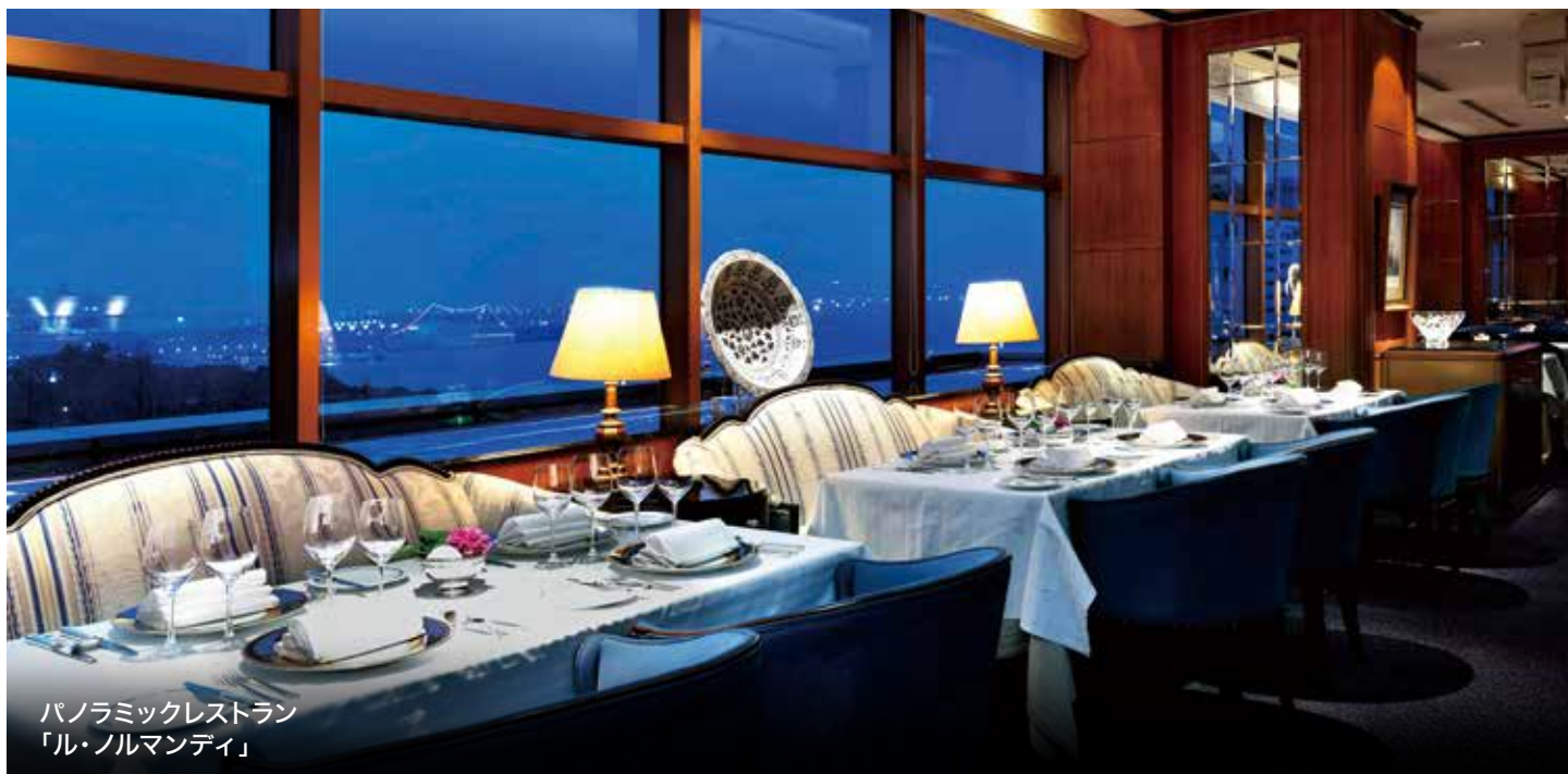
パノラミックレストラン 「ル・ノルマンディ」