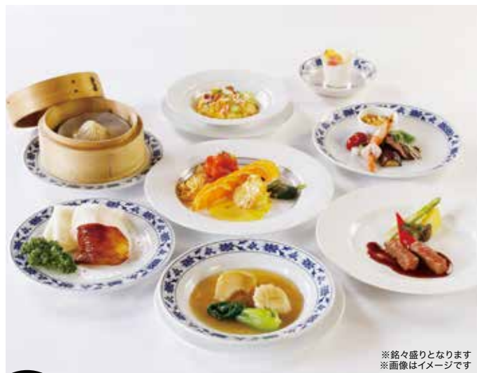
※銘々盛りとなります ※画像はイメージです