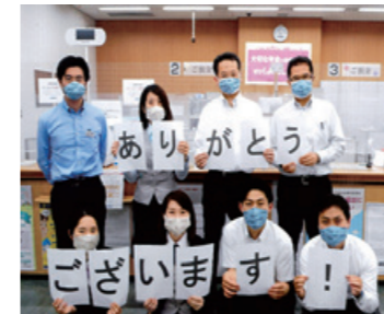
馬場支店：手作りマスクいただきました

地域イベントへの参加やロビー展の開催などのCSR活動に、全営業店61店舗が積極的に取り組んでいます。各営業店の取り組みは当金庫ホームページ「営業店トピックス」で紹介しています。