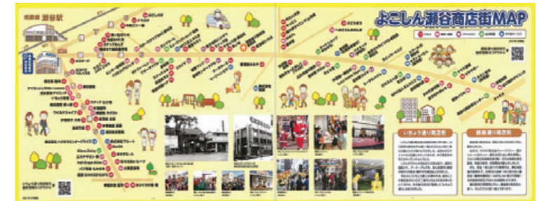
瀬谷支店：ショーウィンドウに商店街マップ掲示