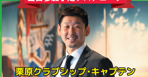
栗原クラブシップ・キャプテン