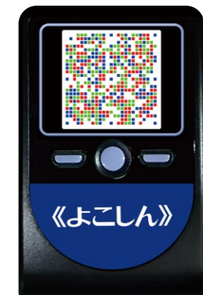
トランザクション認証用トークン